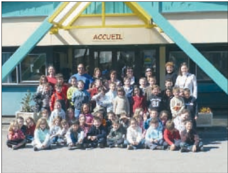
Des enfants heureux de leur séjour

Après des semaines de préparation, les élèves sont partis quatre jours en classe de découverte à Vielle-Aure, dans les Hautes-Pyrénées.