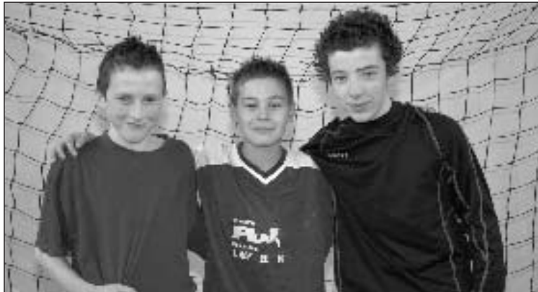
Les jeunes champions de Dordogne UNSS

Samedi 14 mars, les moins de 13 ans garçons gagnent contre Villeneuve-sur-Lot... par forfait.