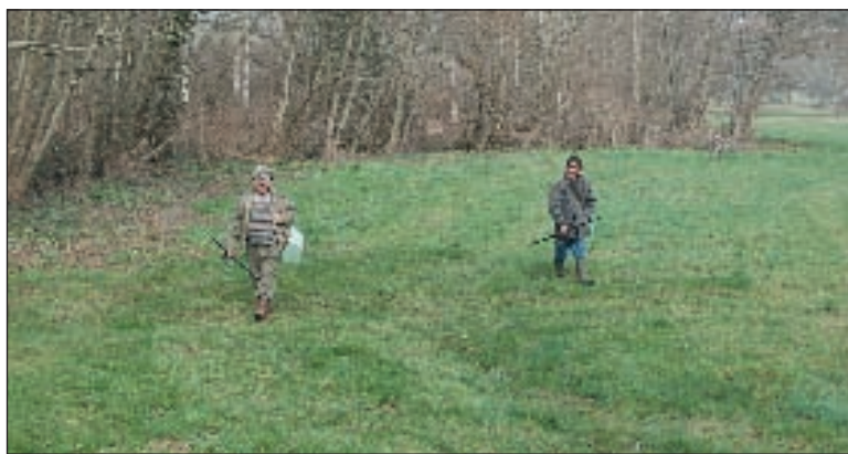
Décrochage sur les bords de la Laurence, ça ne mord pas !

Il fallait jouer des coudes sur les berges des ruisseaux du Montignacois ce samedi 14 mars, jour de l'ouverture de la pêche à la truite. Une belle journée très attendue par des centaines de pêcheurs, dont certains venaient même de Corrèze.