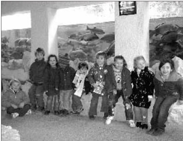
Visite et balade à l'aquarium du Bugue

L'accueil de loisirs de la communauté de communes du Périgord Noir (CCPN) situé à Carsac-Aillac a accueilli les enfants âgés de 3 à 11 ans durant les vacances d'hiver.