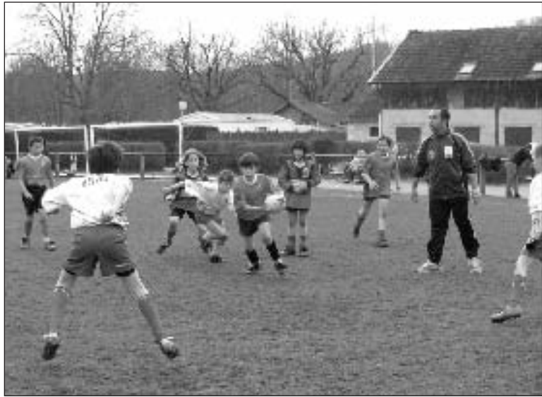
Les rugbymen en herbe