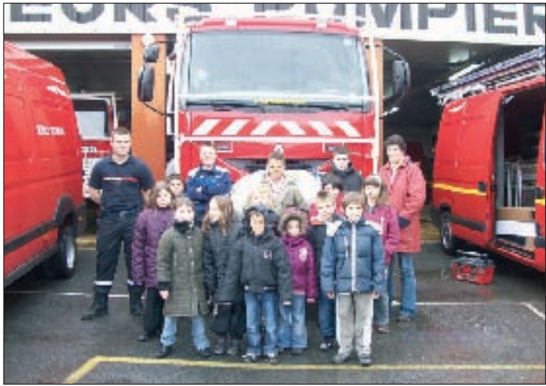
Visite à la caserne