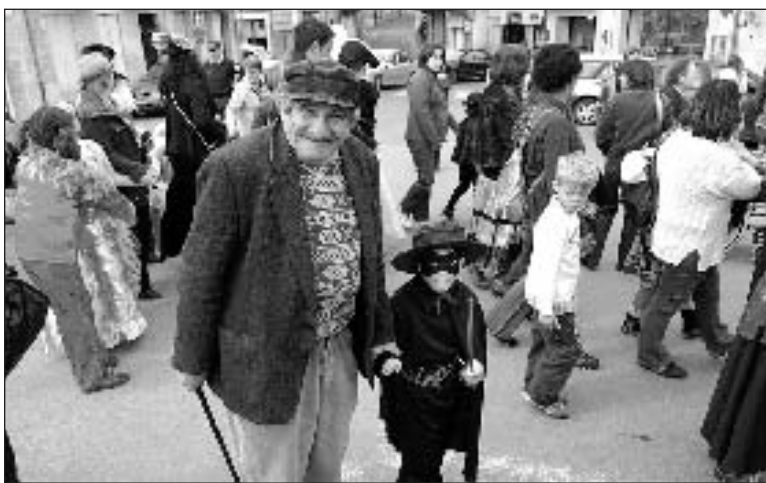
Zorro avec son papi